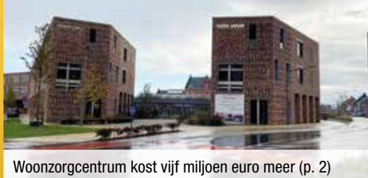
Woonzorgcentrum kost vijf miljoen euro meer (p. 2)